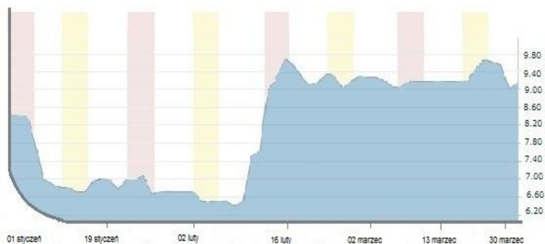
Wykres notowań Spółki DEKTRA SA w okresie od 01.01.2015 r. do 31.03.2015 r.