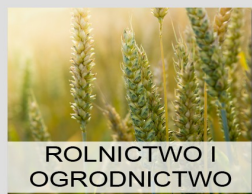
ROLNICTWO I OGRODNICTWO

Od wielu lat budownictwo jest najważniejszym sektorem gospodarki dla Spółki Dektra SA. Swoją ofertę kieruje ona przede wszystkim do dużych odbiorców sieciowych, grup zakupowych i wielooddziałowych hurtowni. Dzięki wypracowanej, przez lata obecności na rynku budowlanym, strategii, doświadczeniu i najwyższej jakości oferowanych towarów, Spółka Dektra SA systematycznie umacnia swoją pozycję, dokonuje kolejnych inwestycji, wprowadzając na rynek kolejne produkty sygnowane własną marką, stając się liderem branży budowlanej.